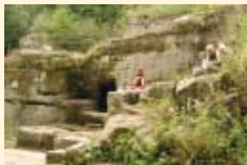
Römisches Bergwerk (Pützlöcher)